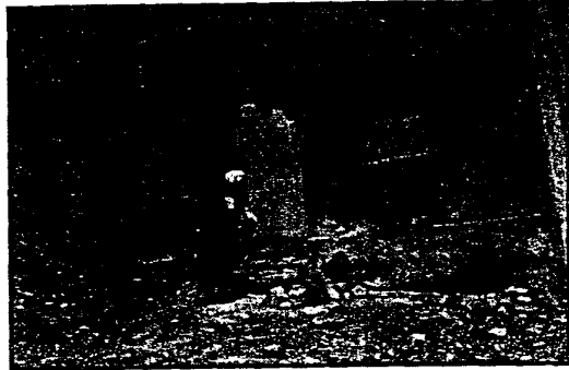
እታ ኣውያት ንጹሓት ናብ ሰማይ ዘዕረገት መስጊድ በስኪ ዲራ