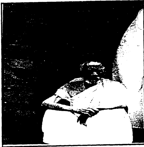
አባይ ተስፋ አልመደም ነታ ወረቀት ናብ ሻምበል ዘገበጸሉ፡ ነዚ ታሪኽ ኣብ ምስናድ ዓዚ ኣበርክቶ ድንገ ምግባር ቁፍብ መዓልታት ጸኒሖም ብምት ከምዘሓለፉ ሰሚዕና መንግሥተ ሠማያት የግረገጻም።