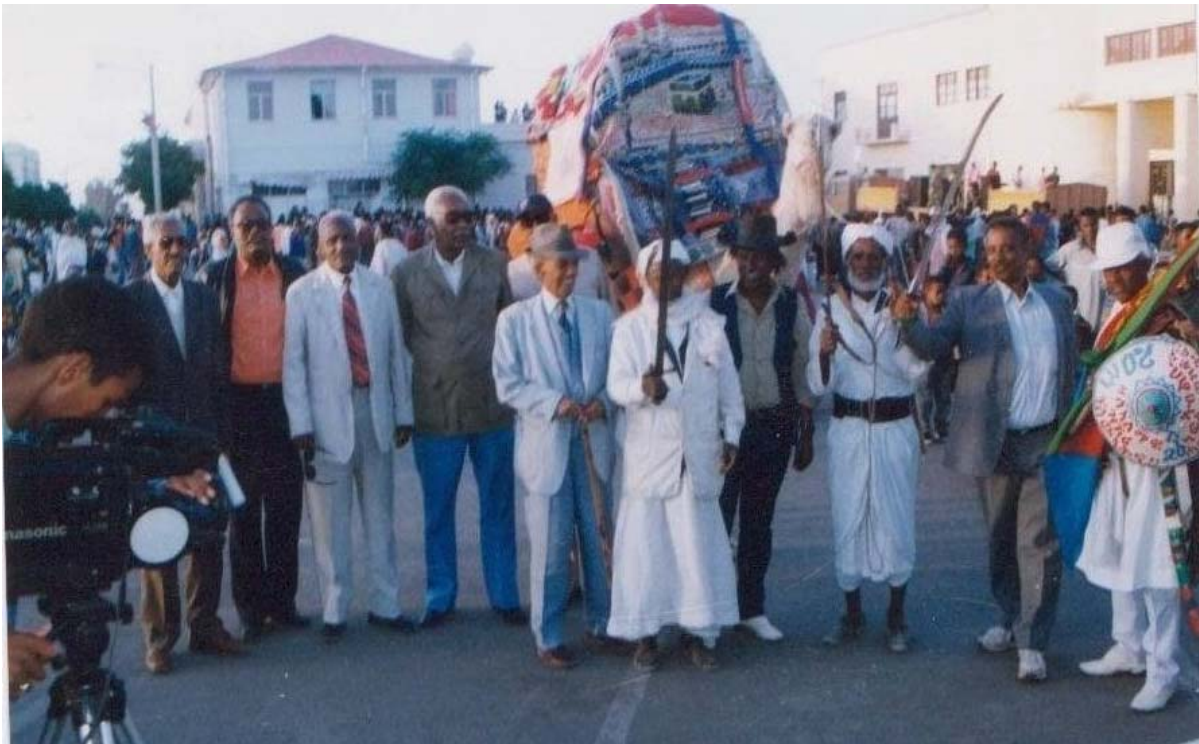
እወ ንዶሞክራሲን ማሕበራዊ ፍትሕን መሲጋገሪ ቁዋምና ውጽኢት ቃልስና መርኣያ ሓደነትና ብተግባራዊ ተሳትፎና ከነዕውቶ ኢና፡ ሓቀኛ መርኣያ ሓደነት ህዝብና።