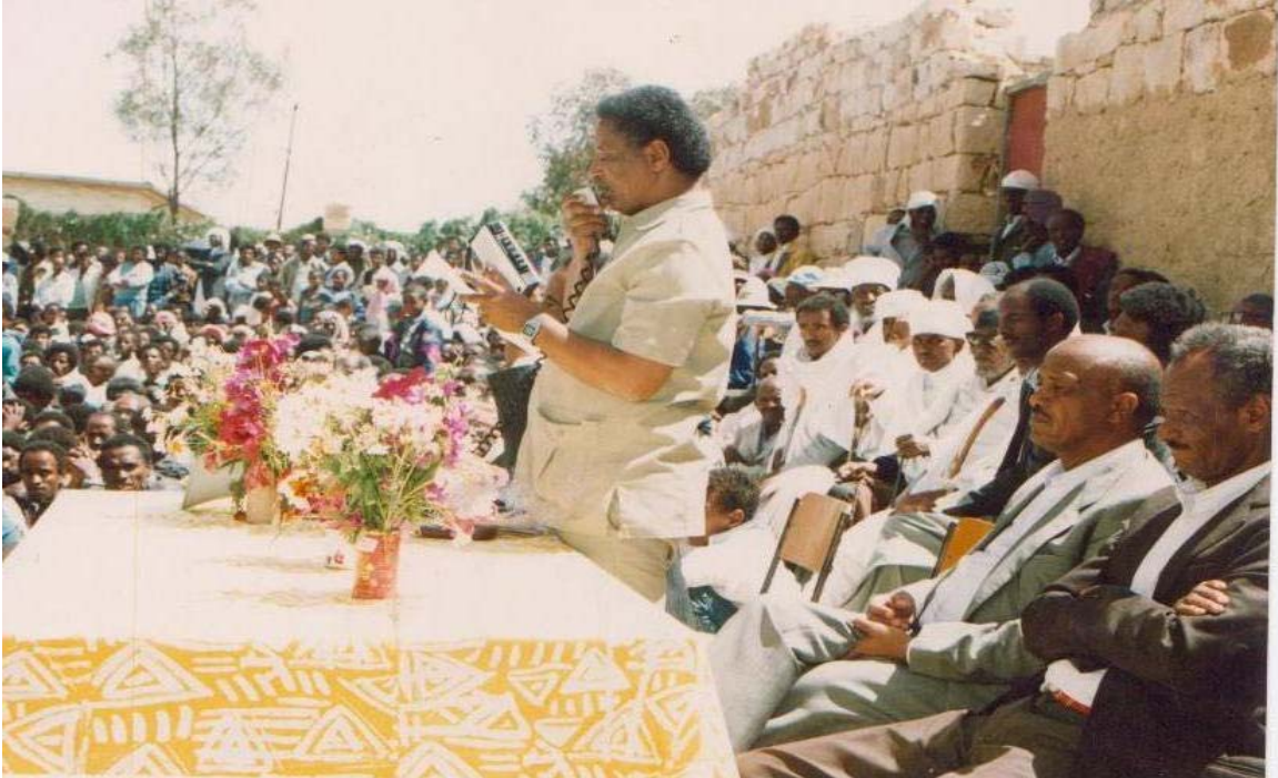
ህዝቢ ዝተቐበሎም መሲጋገሪ ቁዋም ክትግብሩ ከምዝኾኑ ዘረጋግጽ ቃል መንግስቲ ኤርትራ።