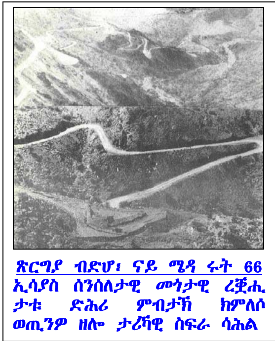
ጽርግያ ብድሆ፣ ናይ ሜዳ ሩት 66 ኢሳያስ ሰንሰለታዊ መጎታዊ ረጅሒ ታቱ ድሕሪ ምብታኽ ክምለሶ ወጢንዎ ዘሎ ታሪካዊ ሰፍራ ሳሕል

ሳሕል ዓበይቲ ታሪካት ዘለዎ ሰፍራ ኢዩ። ንሳሕል ታሪካዊ ሳሕል ከብሎ ዝኸኣለ ረጅሒ፣ ኣቀማምጣ መሬት ናይ ሳሕል ኢዩ። ንሱ ድማ ንኸትከላሽለሎም ኮነ ንኸትሕባኣሎም ምቹኣት ዝኾኑ ብዙሓት ዓበይቲ ኣክራናት ብምህላዎም ኢዩ። ነቲ ደርግ ኣብ 1983 ዘካይዶ፣ ወፍሪ ቀይሕ ኮኾብ (6ዓሻይ ወራር) ዝተሰምየ ንሰውራ ኤርትራ ንኣንሳብን ንመወዳእታን ንምድምሳስ ዘካየዶ ግዙፍ ወተሃደራዊ ወፍሪ ኣመልኪቲ፣ ኢትዮጵያዊ ደራሳይ ኣቶ ብኣሉ ግርማ ኣብቲ ዝደረሰ ኦሮማይ ዝብል መጽሓፍ፣ እቲ ግዙፍ ወፍሪ ናይ ደርግ ዘይምዕዋቲ፣ “ዓርሞሽሻውያን ኣክራናት ናይ ሳሕል ስለዝዘረዩና ኢዮም”፣ ቢሉ ነቲ ዝወረደም ስዕረት ጠንቁ ባህርይ ጥራይ ከምዝነበረ ብድምቀት ኣስሚሩ ስነ ጽሑፍ ደምደመ።