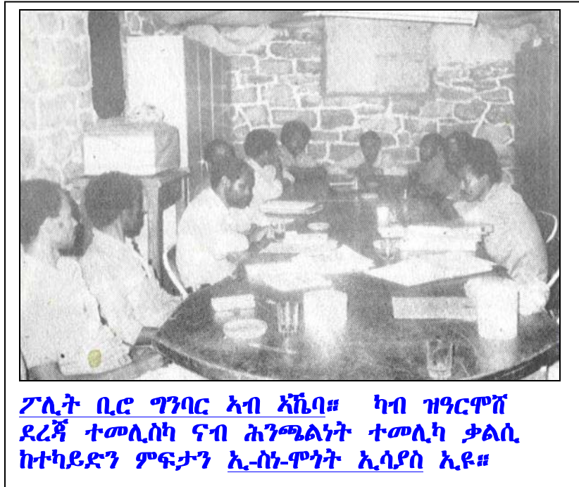
ፖሊት ቢሮ ግንባር ኣብ ኣኼባ። ካብ ዝዓርሞሽ ደረጃ ተመሊሰካ ናብ ሕንጫልነት ተመሊካ ቃልሲ ከተካይድን ምፍታን ኢ-ሰነ-ሞጎት ኢሳያስ ኢዩ።

እዛ ንነብረላ ዓለም ንሕና ደቂ ኣዳም ክንቅይሮ ዘይገኽእል ናይ ባዕላ ዝተፈላለዩ ቀየድቲ ሕግታት ወይ ስነ ሞጎታት ኣለውዮ። ሓደ ካብዞም ሕግታት፣ ሞጎታዊ ምዕ ባሌታት ናይ ኣፈጣጥራ ሂወት ኢዩ። መብዛሕቶም ፍጡራት ካብ ዘርኢ ተባዕታትይን ኣንስታይን ግኹኹም፣ ኣብ ማህጸን ድቂ ኮይኖም ተጠኒሶም መድረኽ ብመድረኽ ግዜ እናሓለዉ ካብ ዝነኣሰ ኣሃዱ ናብ ዝዓበዩ ኣካላት እናዓበዩ ኢዮም ዝምዕብሉ። ምስተወልዱ ከኣ ደርጃ ብደርጃ ይፍርዝኑ፣ ይዓብዩ፣ ይጉብዙ፣ ይኣርጉ። መወዳእታ ከኣ ካብዛ ዓለም ሞይቶም ይሓልፉ።